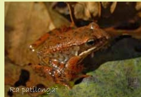
Ra patílonga 2

As libélulas e os cabaliños do demo pintan os aires do Tea de cores cada verán. Na súa fase xuvenil son acuáticos, e esixen augas moi limpas. A diversidade de especies presentes no Tea é bo indicador da súa calidade.