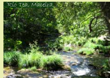
Río Tea, Maceira

Na conca alta do Tea crían ata 13 especies de anfibio. A ra patílonga, especie endémica do noroeste peninsular, é frecuente no río, nos regatos e nas levadas que pasamos no camiño.