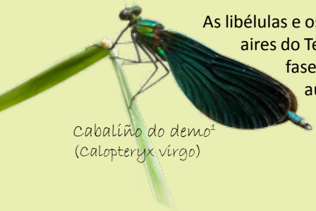
Cabaliño do demo 1 ( Calopteryx virgo )

As libélulas e os cabaliños do demo pintan os aires do Tea de cores cada verán. Na súa fase xuvenil son acuáticos, e esixen augas moi limpas. A diversidade de especies presentes no Tea é bo indicador da súa calidade.